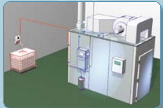
Wenn der TARBER SMOKE MASTER Raucherzeuger montiert worden ist, braucht man kein Lager für Holzspäne oder kostspieligen Abluftreinigungssysteme mehr. Eine Palette flüssiges Rauchkondensat ersetzt 4-5 Paletten Holzspäne.