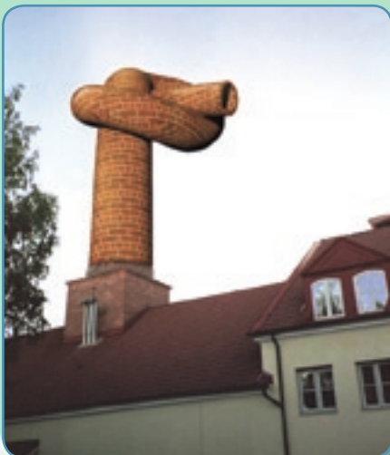
Med Tarber Smoke Master er der intet behov for omkostningstunge luftrensere eller katalysatorer. Der er intet udslip til miljøet – fra fremstilling til slutforbruger af røgkondensatet.

Ingen eksplosions risiko ifølge EU-direktivet 94/9/EC, ingen brandfare. Sundhedsfarlig håndtering af træflis, aske og støv undgåes helt, ingen røg udenfor røgeovnen. Ingen sundhedsfarlig rengøring af TSM behøves. Røgeovnen rengøres let, forbruget af rengøringsmidler minimeres med op til 70 %.